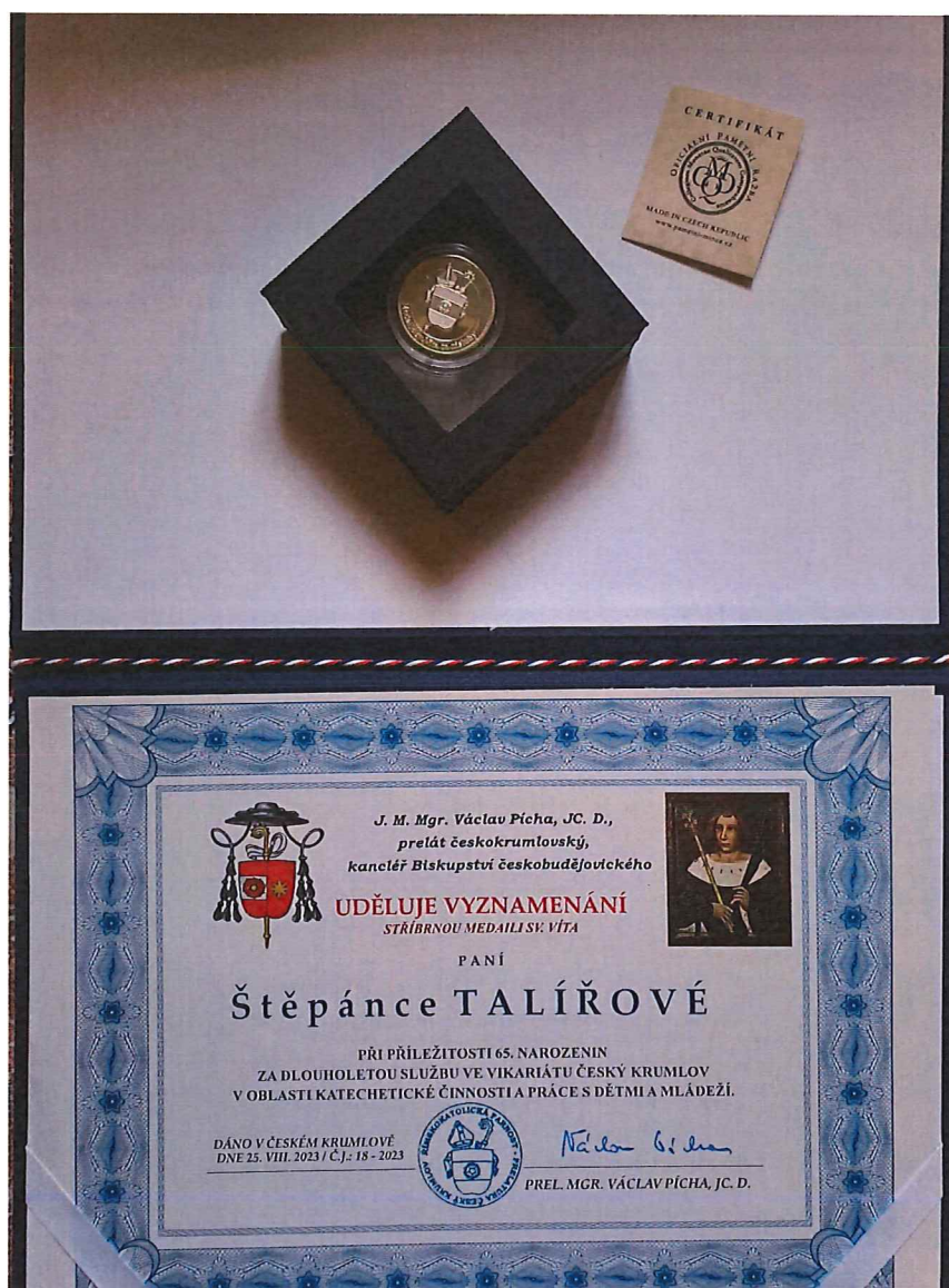
stříbrná medaile sv. Víta s certifikátem a diplom